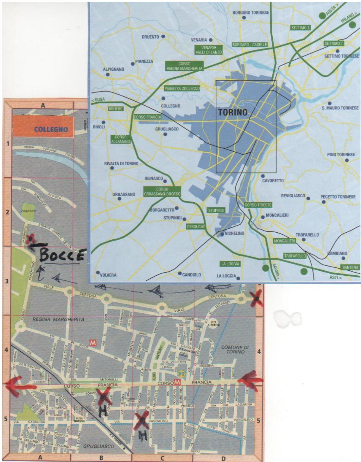
Tavola: 2 e 3/A - B - C - D - Tavola: 2 "X Campo di Bocce e Strada Viale Certosa", Corso Marche a Torino. Tavola: 4 e 5/A - B - C - D - Tavola: 4 e 5 "da Rivoli a Corso Francia" in seguito da Collegno.

Tavola: 2/A - Campo e Tavola: 3/D - Strada sia Viale Certosa fino angolo Corso Pastrengo sia campo. Vedi Bene: Autostrada di Tangenziale del Nord (Milano) e Sud (Savona/Genova e Piacenza/Brescia).